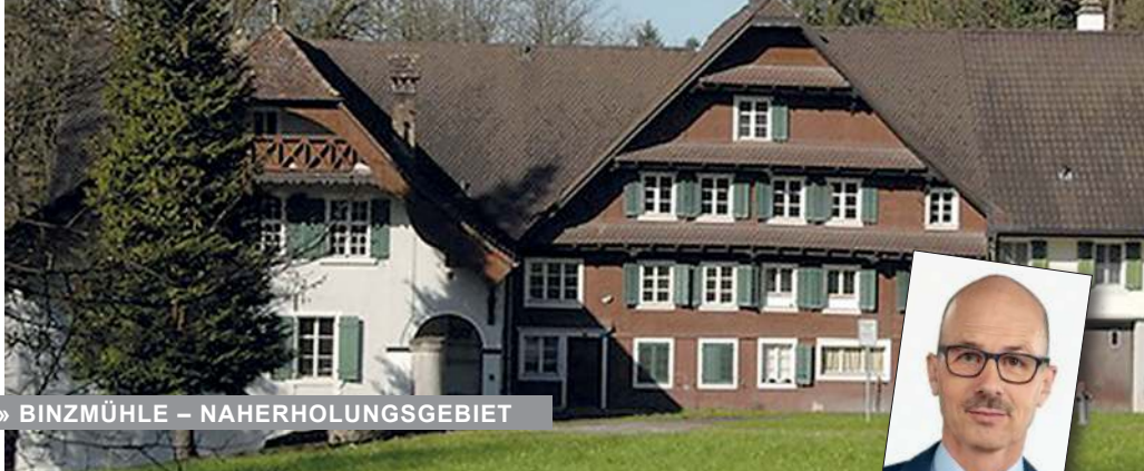
» BINZMÜHLE – NAHERHOLUNGSGEBIET