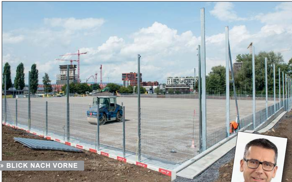
» BLICK NACH VORNE